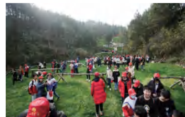
师生们在模拟战场遗址体验