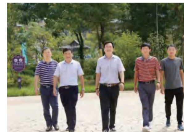
返乡创业团队代表

这一“旅游观光+红色教育”的开发模式已成为湖北省旅游业创新发展的经典案例，在全省返乡创业项目中树立典范。