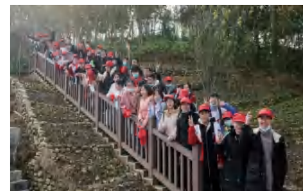
研学团队向红色基地进发