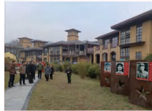
在红25军文化长廊瞻仰六大领军人物

考察团队上午沿“红25军长征缩微路”边走边看，听讲解，提意见，随后进入大别山革命历史文化陈列馆参观，直到中午十二点，才结束现场调研。下午，专家团和体验园管理班子召开座谈会，就如何进一步做好红色体验式教育交流意见和建议。