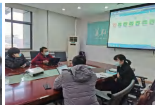
集团办公室到美联地产了解OA系统

当今互联网环境下，企业办公系统的线上化、无纸化已成为企业提高管理、业务效率的一大利器，一方面，这是企业积极履行社会责任，响应环保、节约的号召，另一方面也在一定程度上体现了企业的现代化组织水平和管理档次。