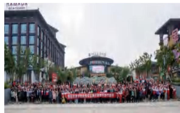
罗田思源学校研学旅行团队合影

倾听完研学导师声情并茂的讲解之后，许多同学纷纷表示，以前都是在课堂上接受革命传统教育，但这次通过以红色文化教育为主线的研学实践活动，重走长征路，聆听党史专家的讲解，以及户外拓展等一系列方式，完美地达到了寓教于乐的目的，校方给“基地+课堂”的教学方式，以及专业的教学组织都给予了高度评价。