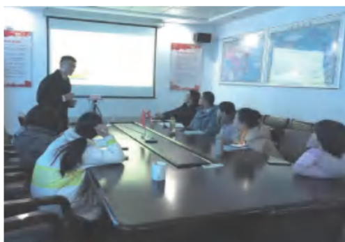
各部门认真学习办公软件应用场景

好的使用线上办公软件提高办公效率。各部门员工认真学习，就各自工作中遇到的问题和需求踊跃提问。