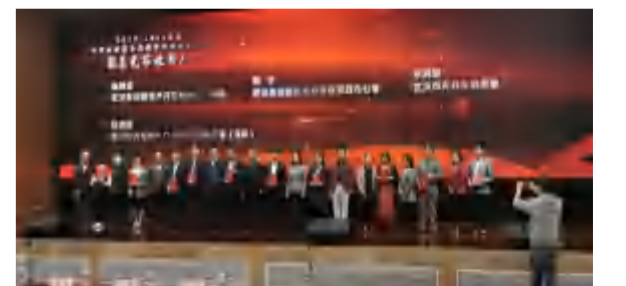
中国光谷·党工委组织十大“最美光谷读书人”活动

——政商关系：集团体系各相关产业主体公司的政商关系进一步优化和密切，相关单位持续得到省、市、县领导的关心、重视和支持，各级领导指导视察、现场办公的频次在2021年一季度明显提高；“中信仁和集团党建共建”、“四季花海文旅康养融合发展”、“英山四季花海联合片区党委”、“英山九龙湾乡村振兴先行区”等模式案例，不断提升政治站位和社会效益，引发综合效应；集团综合资源优势得到进一步发挥，在整合武汉特别是东湖高新区党建及红色教育培训资源方面亮点突出、效应在不断显现；媒体关