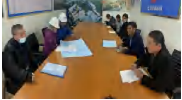
2021年3月15日，武汉光谷第五小学足球分校项目高支模专项施工方案专家回访。