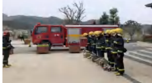
2021年3月9日，湖北消防黄冈支队在四季花海华美达酒店进行消防系统演习检查。