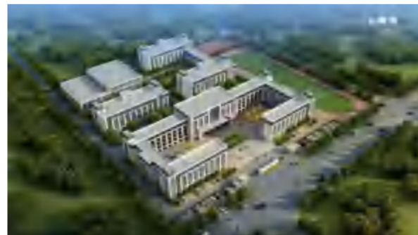
2021年4月3日，新时代国际学校落户四季花海项目区。