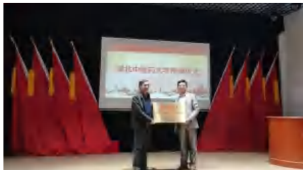
2021年4月15日，湖北中医药大学党员干部教育基地在英山长征精神体验馆挂牌。