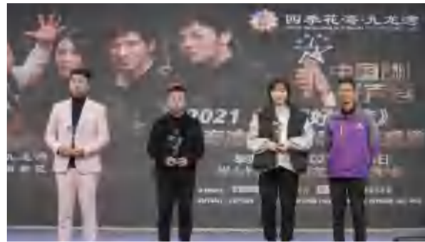
2021年3月8日，中国好声音英山赛区颁奖典礼在四季花海·九龙湾A区举行。