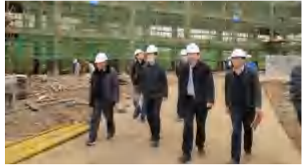
2021年3月10日，董事长参加武汉光谷第五小学足球分校项目工作目标及责任清单讨论会。