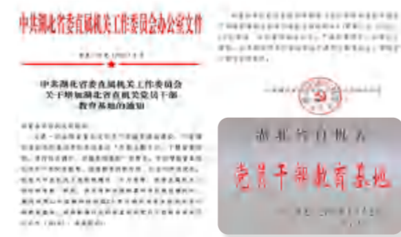
长征精神体验馆被中共湖北省直机关工委增加到党员干部教育基地列表

——社会荣誉：在全省脱贫攻坚总结表彰大会上，湖北四季花海旅游发展有限公司被授予“全省扶贫攻坚先进集体”；湖北省政府对2020年“与爱同行 惠游湖北”活动的先进单位进行表彰，英山四季花海景区被评为“优质服务景区”；由湖北省文旅厅组织的“全省红色旅游十佳评选活动”中，英山长征精神体验馆入围参选“红色经典景区”、3名讲解员入围参选“红色讲解员”并名列前茅；在黄冈日报社、鄂东晚报组织的网络评选中，四季花海景区、养心苑野奢酒店被评为“黄冈市旅游网红景点打卡地”、“黄冈市网红民宿”；四季花海旅游公司被评为英山县2020年文旅工作先进单位，并在全省文旅工作会议上作典型交流发言。