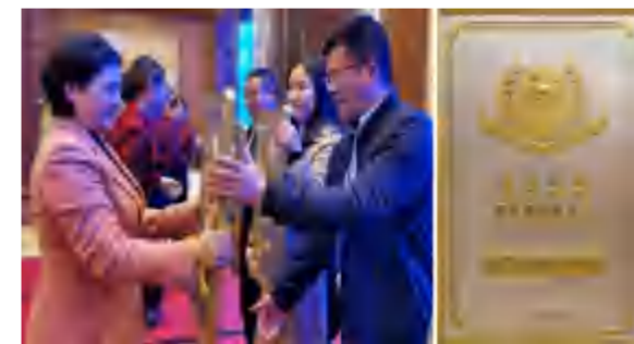
省文旅厅厅长雷文洁为四季花海颁授国家AAAA级景区牌匾

——品牌建设：英山四季花海景区正式完成“国家AAAA级景区”挂牌；英山长征精神体验馆被中共湖北省直机关工委认定为“湖北省党员干部教育基地”；四季花海置业公司“房地产开发资质”从暂定级升至四级；中德仁和建设工程有限公司启动了工程总承包一级资质的晋升准备工作。