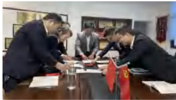
2021年3月1日，集团组织党员举行五星党组织“做模范，践行动”承诺签字仪式。