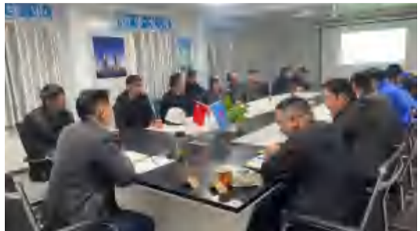
2021年3月15日，建筑事业部东方明珠B区项目召开各分包班组质量、安全、进度会议。