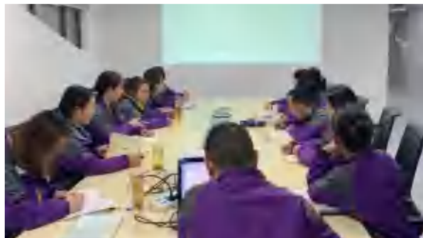
2021年3月16日，四季花海旅游公司财务部学习财务管理制度。