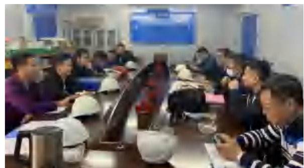
2021年3月9日，云东海26-31座、幼儿园工程主体结构分部验收