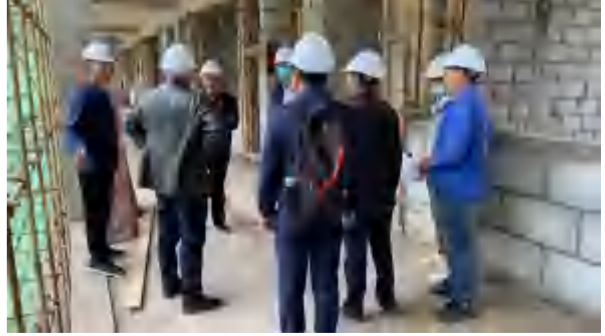
2021年3月30日，教育局及街道办对武汉光谷五小足球分校项目样板间进行检查及提出指导。