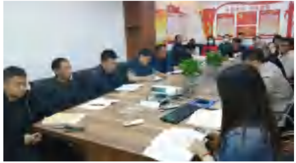
2021年3月22日，中泰地产公司学习讨论管理制度。