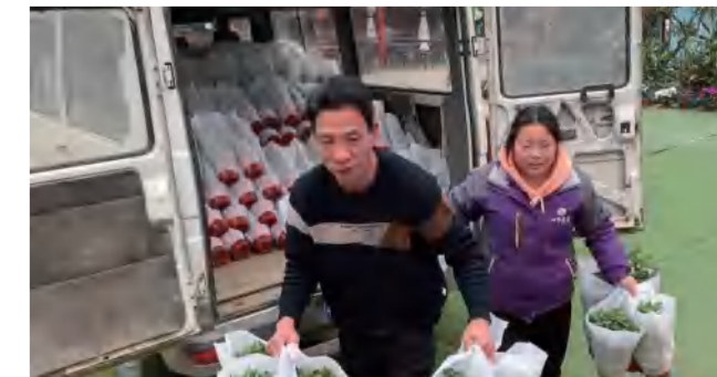
园林部更换景区花坛观花花卉