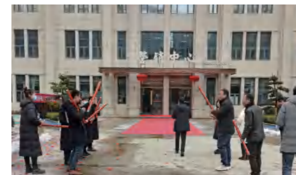
中泰地产公司新年开工大吉