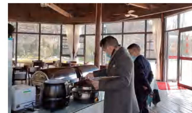
温泉酒店公司餐饮部开展卫生质量大检查