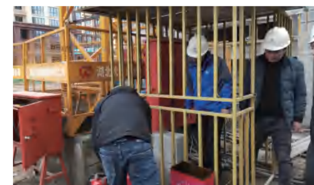
东方明珠B区项目部新年开工前安全检查