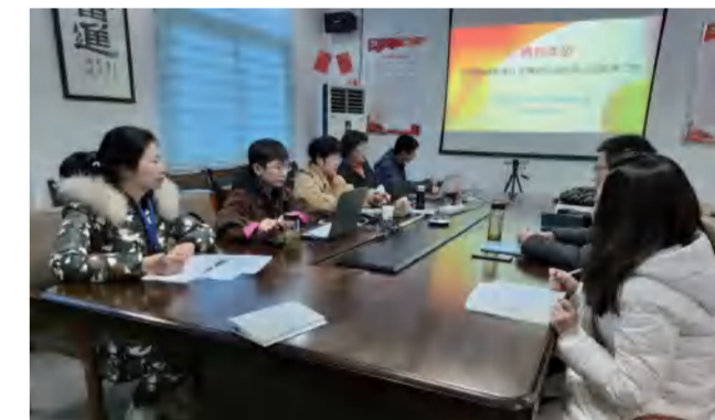
中德仁和公司三大体系再认证专家认证会