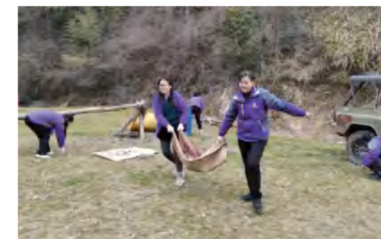
景区员工开展环境清理活动