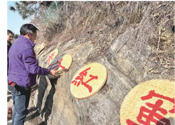
铭先红色文化公司新年开工员工自己动手维护红色游线