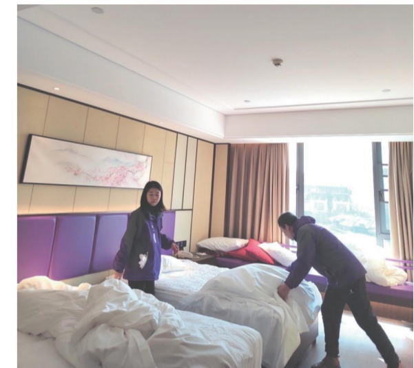
四季花海公司后勤人员协助帮助华美达酒店抢做客房卫生