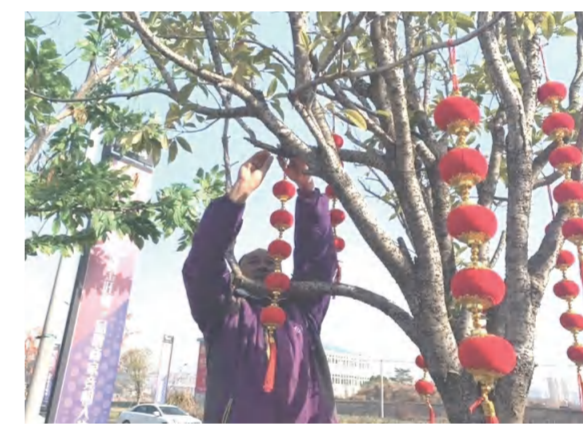
六合众物业公司营造小区氛围过大年