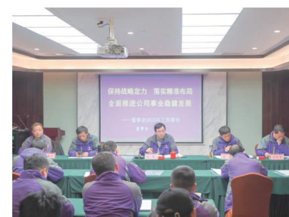
大年初五，四季花海公司股东会三届三次会议召开