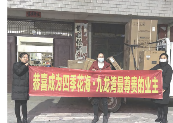
四季花海九龙湾A区开展业主购房送家电活动