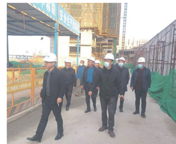
腊月二十九日，建筑事业部安排专人星夜奔驰佛山项目工地保障农民工工资年前发放