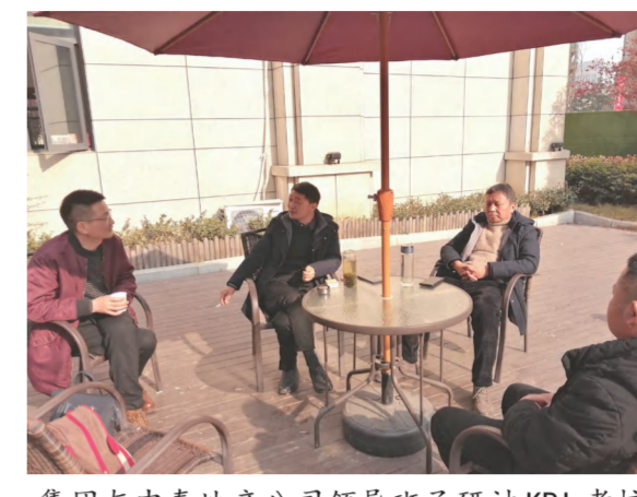
集团与中泰地产公司领导班子研讨KPI考核及流程化管理工作