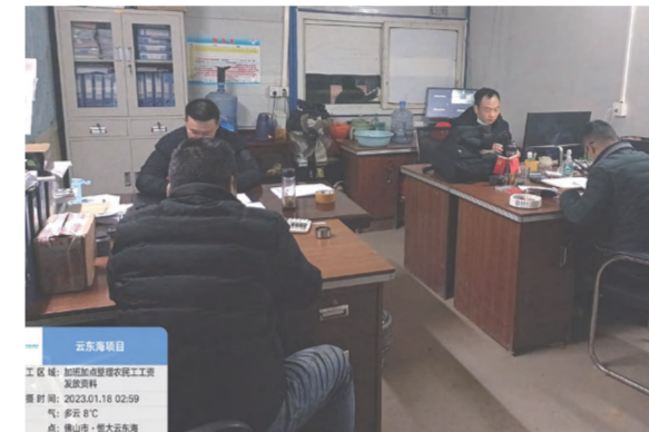
集团与中泰地产公司领导班子研讨KPI考核及流程化管理工作