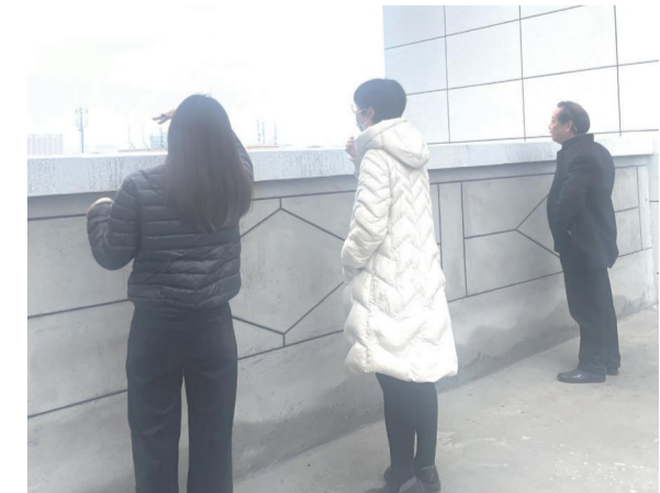
武汉东新区光电办领导现场检查中信仁和制造基地项目建设情况