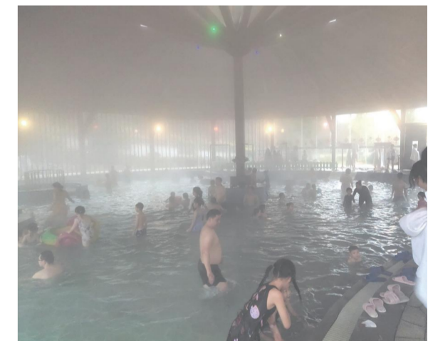
花乐汤温泉正月日均接待过2000人