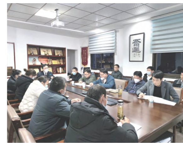
董事长主持召开专题会部署年前收尾保稳工作