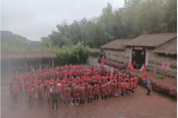
省直机关工委党校培训班学员冒雨接受长征精神教育