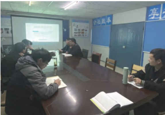
中泰·大公馆项目开展起重机械安全检查重点及常见隐患识别判断学习