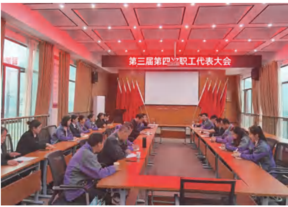
四季花海公司三届四次职代会召开