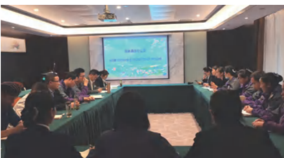
英山华美达酒店开展温德姆质检技能分享培训