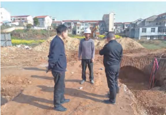
董事长在红安高桥派出所建设项目现场指导