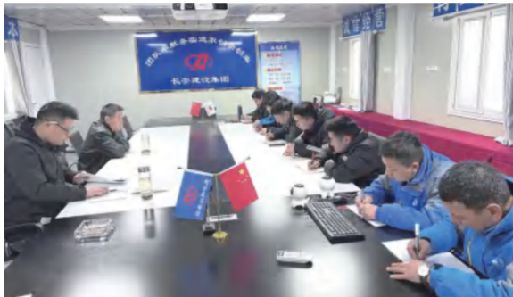
红安人民医院项目专题研究项目建设进度