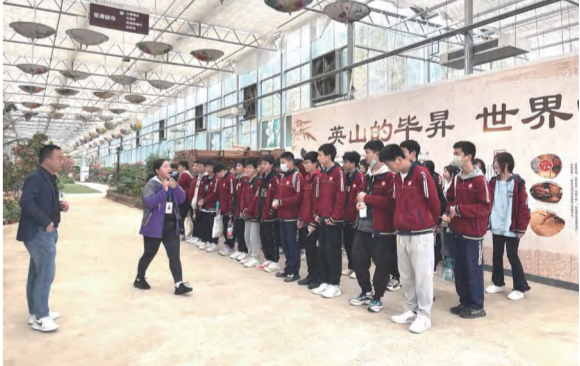
英山实验中学在四季花海开展研学实践教育