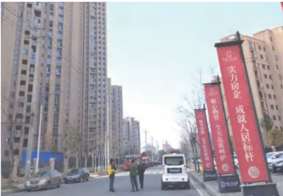
顺风置业公司加强中泰·大公馆楼盘门前道路清理整顿工作