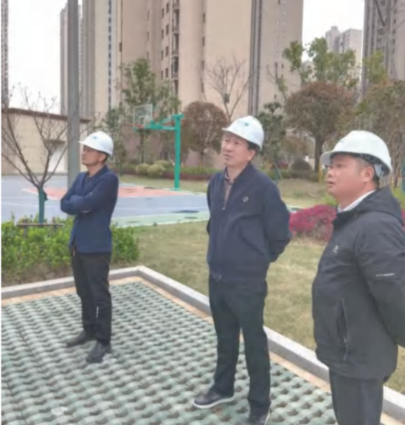
中泰地产高层现场研究中泰大公馆二期开发项目工作