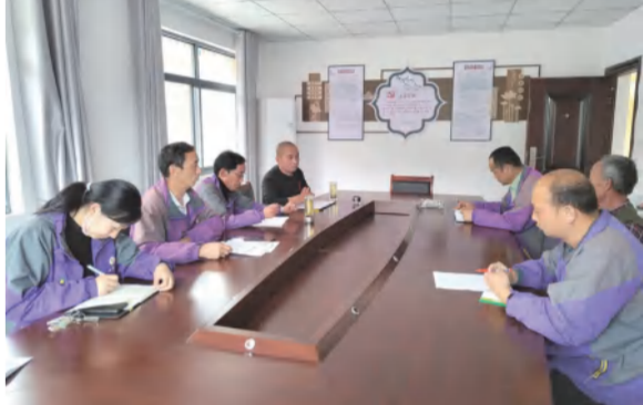
六合众物业人员现场培训消防知识