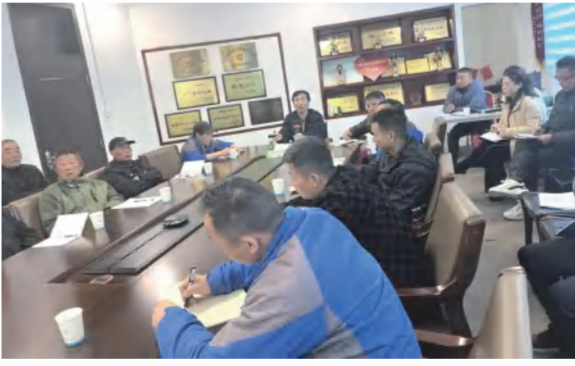
建筑事业部采购供应部组织钉书系统采供管理应用培训