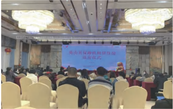
九龙湾A区产品加强英山保障性住房对接销售