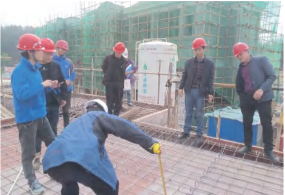
花海置业公司总经理带队加强工程项目月度检查督查