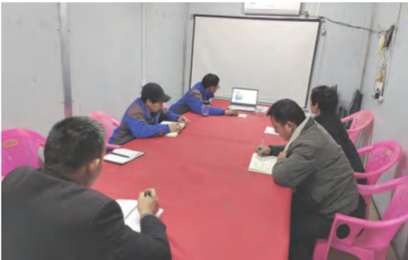
各项目部认真学习建筑工程文明施工现场创建做法与检查要点