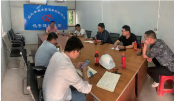
佛山山东海项目举行26-37座签证梳理及18-25座甲供材申报会