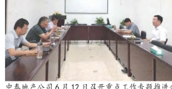
中泰地产公司6月12日召开重点工作专题推进会