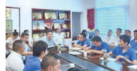
集团总部暨建筑事业部特邀法律顾问举行全员法务培训