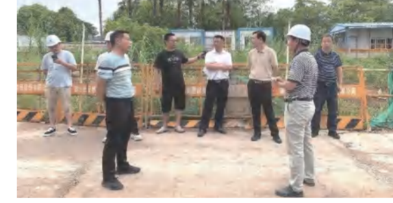
六月下旬以来，董事长率建筑事业部加强对佛山云海项目的驻场指导