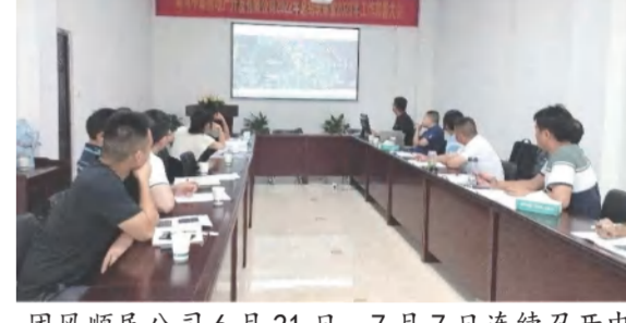
团风顺民公司6月21日、7月7日连续召开中泰·大公馆项目二期设计方案优化三方专题会