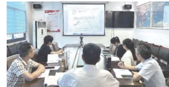
集团总部人员进行公文写作培训并对每周公文写作考试结果点评