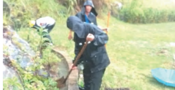
四季花海旅游、置业、物业人员齐心协力应对暴雨抗汛排险