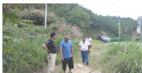
七星拱月农业公司现场对接雷店镇蔡山村二期园林工程