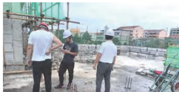
建筑事业部生产保障部加强对红安县公安局高桥、宽儿派出所项目的现场安全检查及指导