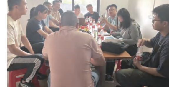
中信仁和制造基地项目竣工验收工作7月4日全力推进消防复验