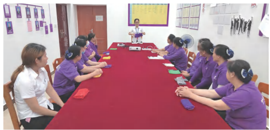
酒店工作人员正在培训