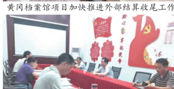
四季花海公司工程项目遗留结算专题会