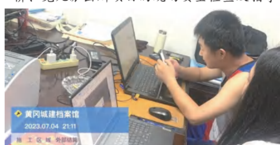
黄冈档案馆项目加快推进外部结算收尾工作