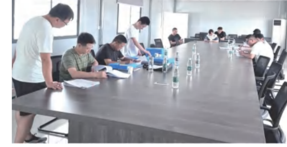
红安县人民医院项目接受当地建设局、卫健局的联合检查