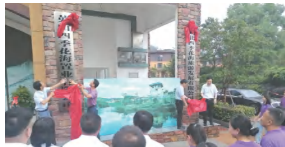
四季花海旅游、置业公司7月8日举行新办公区入驻揭牌仪式