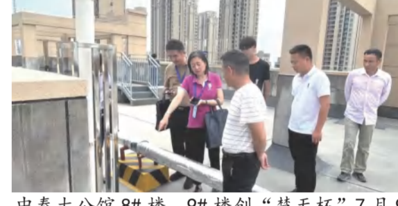
中泰大公馆8#楼、9#楼创“楚天杯”7月9日迎接验收好评