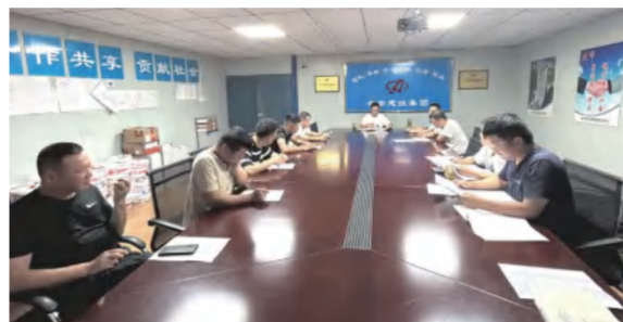
湖北金港汽车公园项目7月8日举行班组技术质量、安全文明、生产进度专题会议