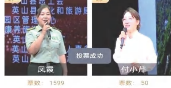
投票成功 凤霞 票数：1599 付小芹 票数：50