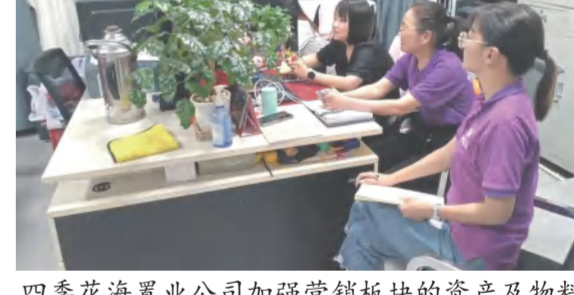
四季花海置业公司加强营销板块的资产及物料管理台账、物业空置房产台账管理检查