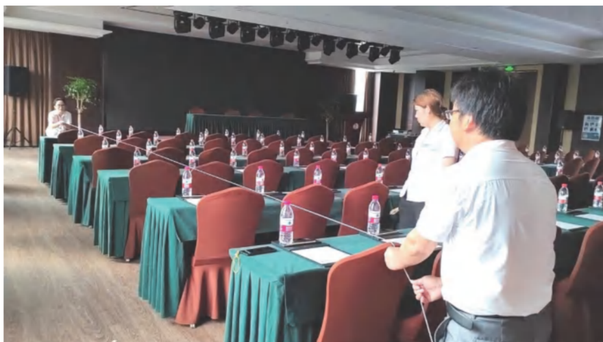
酒店工作人员精心布置会场

创建优良的企业服务文化，需要团队全员认同并践行的服务价值观。作为服务行业，团队应集合力量服务客户，形成“上级服务下级、后勤服务前勤、全员服务客户”的