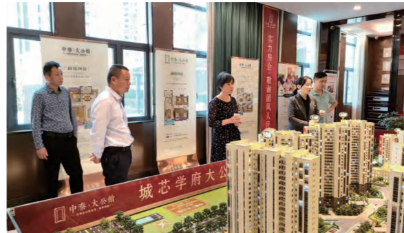
省住建厅、国风住建局领导一行到中泰大公馆项目调研并指导工作