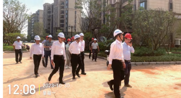
10月30日佛山三水区委领导现场验收恒大·云东海项目18-21座交接情况