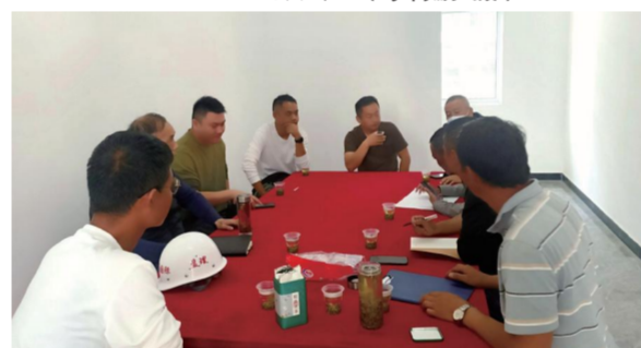
红安七里坪派出所基础验收槽