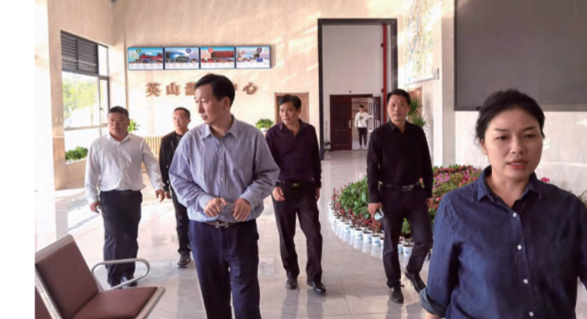
四季花海公司高管层到英山游客中心交流学习