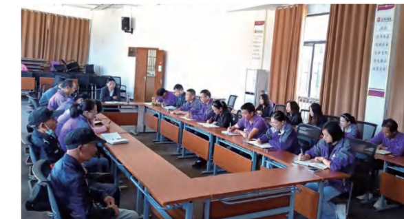
四季花海置业公司召开开源节流思想教育专题会