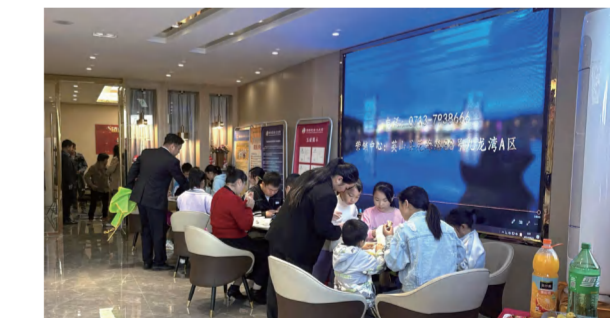
英山九龙湾A区项目举办DIY暖场活动