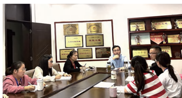
建筑事业部成本预算软件对接会议