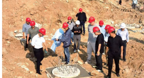
10月31日红安泛家居项目3号11号厂房桩基验收 (魏小洁 摄)