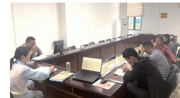
中泰·大公馆一期总包土建结算及施工现场问题沟通会