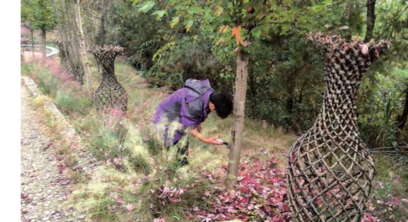
七星拱月农业公司为观景树木打药养护