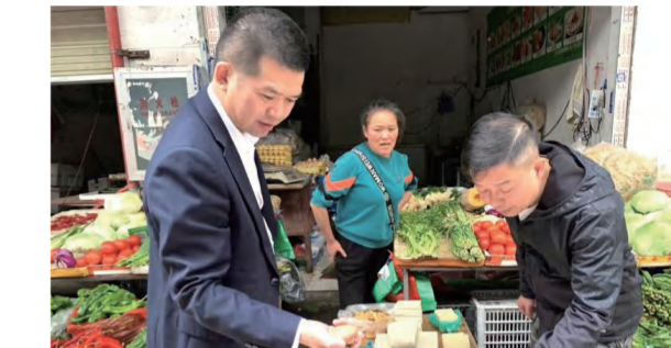
英山华美达酒店调查餐饮食材市场状况