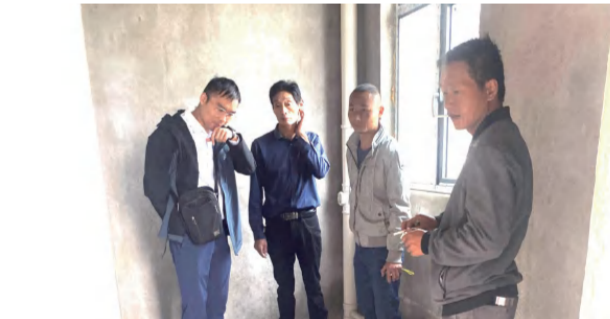
英山县城投公司在九龙湾督促保障房装修工作