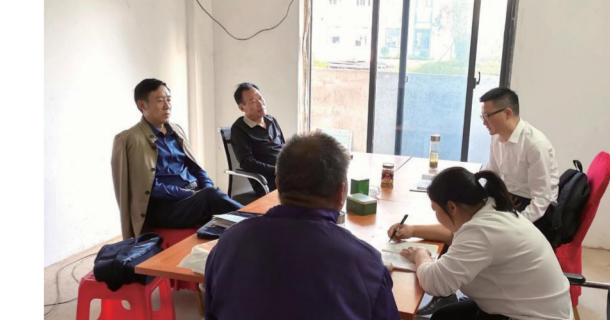
中信仁和集团光谷总部前期物业整改会