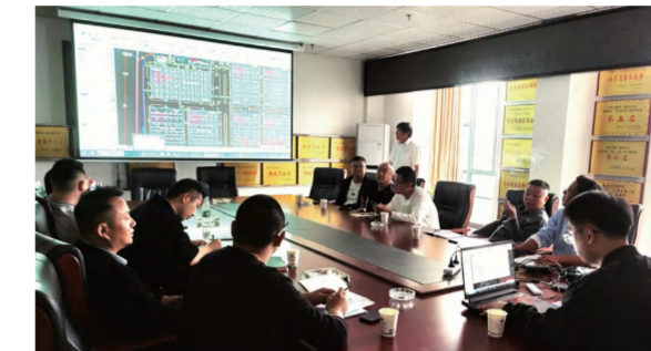
红安泛家居项目室外配套道路管网工程标高调整会议