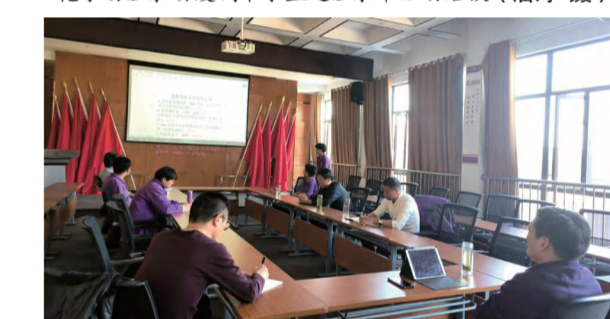
四季花海公司主题研究园林生产工作