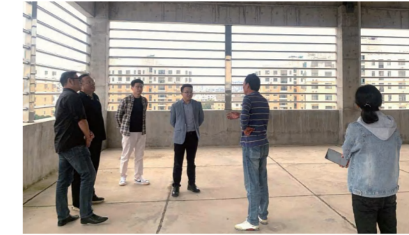
武汉东湖高新区教育局在中信仁和制造基地进行教育项目选址考察