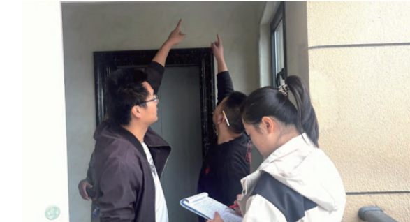
中泰·大公馆一期消防竣工验收