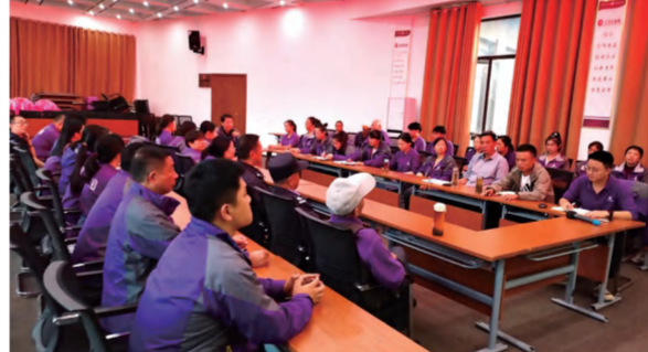
四季花海景区安全培训 (郑伦发 摄)