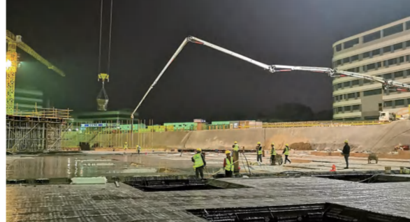
红安县人民医院二期A区底板防水保护层混凝土浇筑