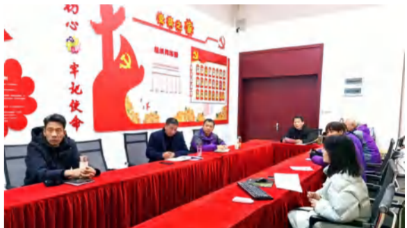
七星拱月公司组织2024年园林景观设计师研讨会