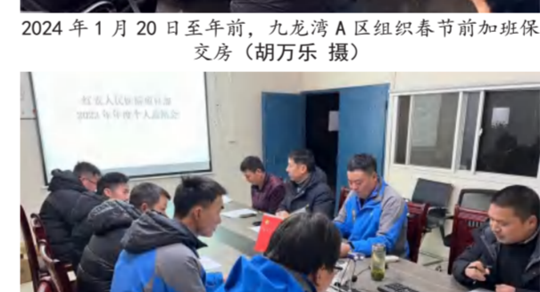
2024年1月下旬，建筑事业部各项目认真组织个人年度总结（图为红安县人民医院项目）