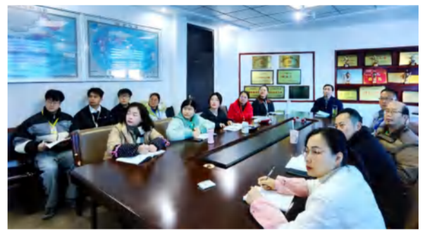
2024年1月13日，建筑事业部组织财务、采供、成本预算人员联合开展钉钉系统软件互通研讨会