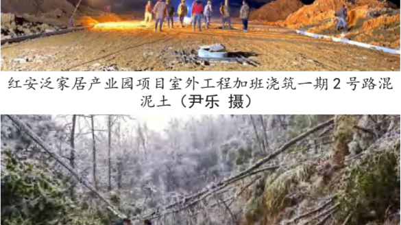
英山四季花海景区清除雪灾害压垮树木路障（占超 摄）