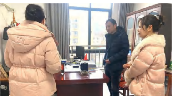
花海置业加强与英山县城投公司对接保障房销售年前回款工作