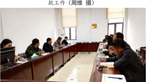
大年初九，顺民置业召开新年开工启动会