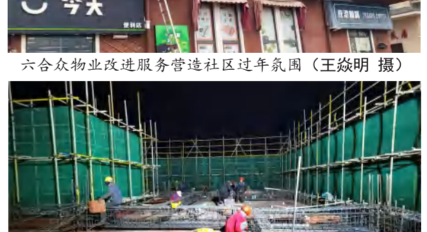
2024年1月14日，红安泛家居产业园厂房项目保年前生产计划加班绑扎1#综合楼四层平面钢筋