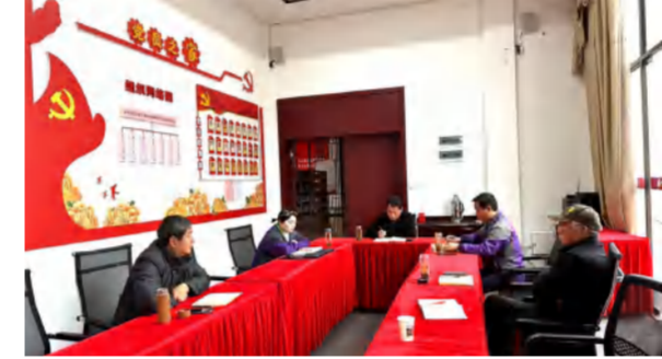
铭先文化公司组织2024年红培研学研讨会