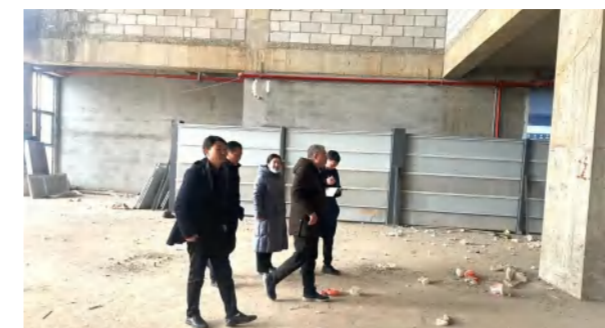
2024年1月29日，黄冈市住建局领导在中泰大厦现场了解购房情况