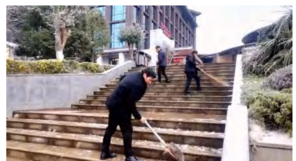
四季花海公司总经理带头组织员工做好雨雪冰冻天气应对工作