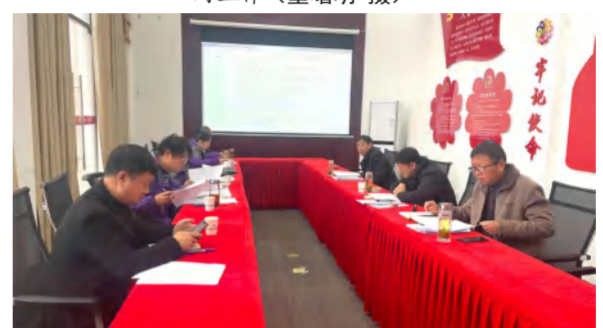
2024年2月20日，中泰地产、花海置业公司专题研究2024年生产、销售、财务工作