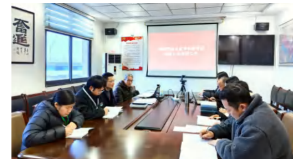
2024年1月26至29日，中德仁和完成质量、环境、职业健康安全一体化管理体系认证年度审核