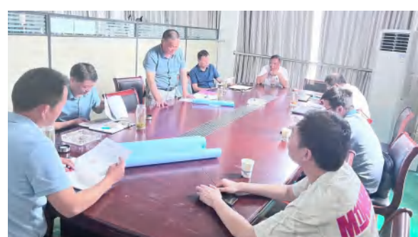
六合众物业承接验收