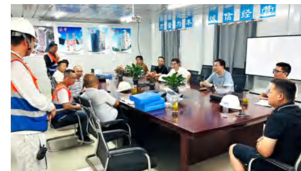
董事长参加武穴天地项目综合检查