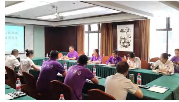
温德姆绿色认证项目二级认证研讨会