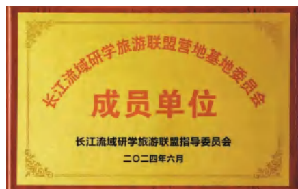
四季花海公司被授予联盟成员单位

（英山长征精神体验馆讯）6月12日，长江流域研学旅游联盟基地建设交流展示会在江苏常州召开，会上对首批入选的123家长江流域研学旅游联盟基地委员会成员单位进行了授牌。湖北四季花海旅游发展有限公