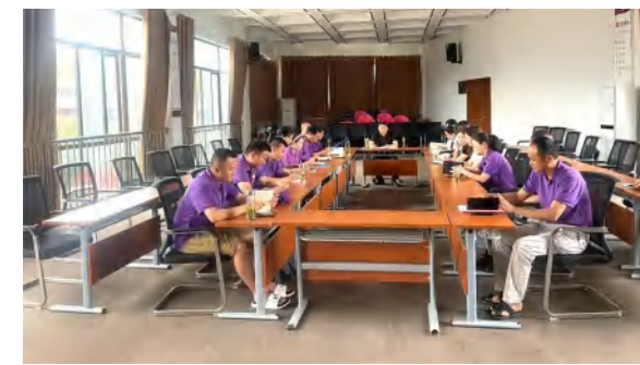
花海置业公司6月制度学习培训