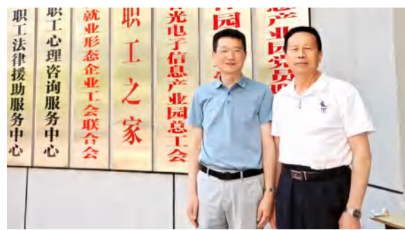
集团工会与光电园总工会对接工会管理工作