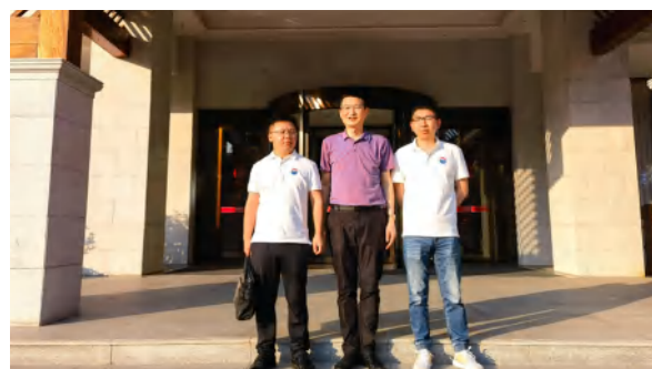
茅台集团湖北公司与中信仁和集团在四季花海进行客户联动