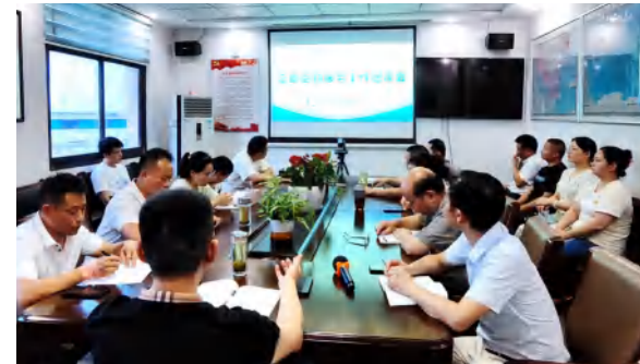
集团召开总部后勤服务工作座谈会