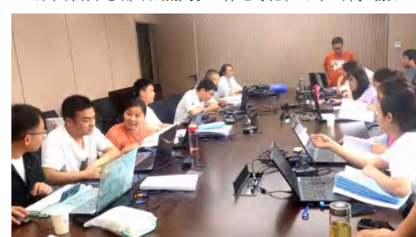
鑫龙湾项目签证变更小核算核对