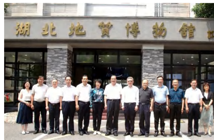
考察组在省地质博物馆合影

省政协经济委员会组织开展的“一联三促”（即常态化联系界别委员、促学习促履职促发展）活动，旨在发挥经济委员会广泛联系经济界别和工商联界代表人士与界别群众的优势，以“察民情、解民忧、暖民心”为主题，深入委员所