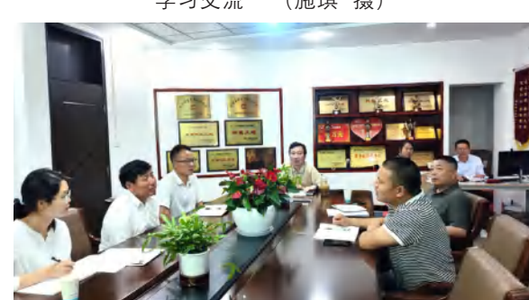
红安泛家居产业园项目签证管理工作会