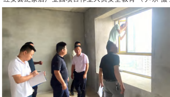
顺民置业组织团风中泰大公馆11号楼分户验收