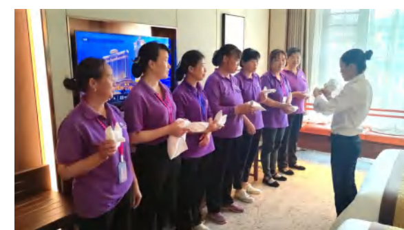
华美达酒店客房布草折叠装饰培训