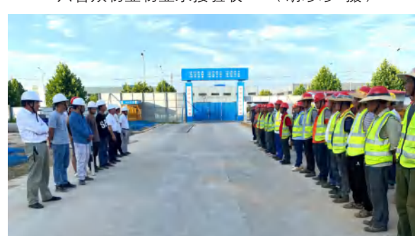
红安县泛家居产业园项目作业人员安全教育