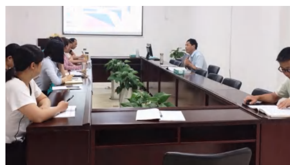
中泰地产公司2024年5月员工培训