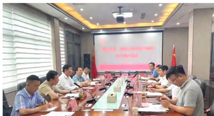
各方领导在战略合作协议签署会场

（武穴城投消息）5月22日，武穴市城投集团与湖北长安建设集团、湖北恒尚建设工程有限公司与签署战略合作协议，推动合作的新企业一恒