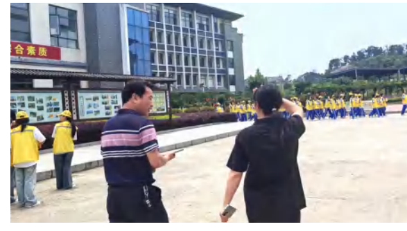
四季花海研学基地到黄梅县向日葵研学基地开展学习交流