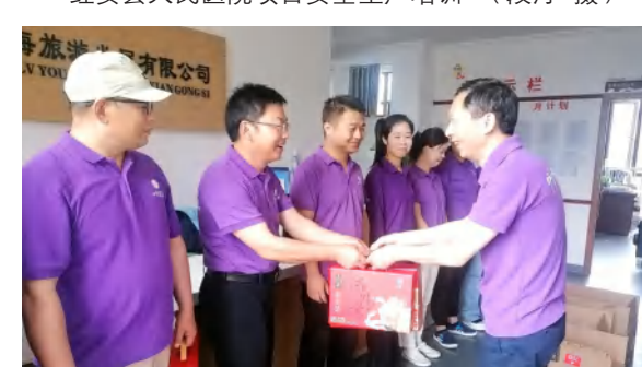
端午节员工福利品发放