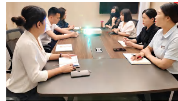
中泰地产销售部到花海置业销售部交流地产抖音短视频制作经验