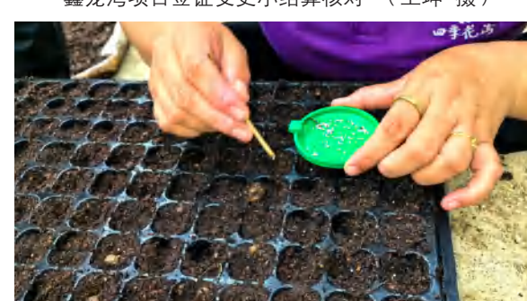
七星拱月公司对洋桔梗品种进行穴盘选种