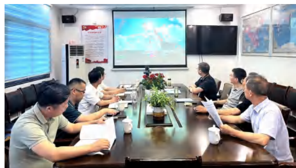
黄冈市、麻城市住建局领导来中信仁和集团研讨项目对接工作

长江自青藏高原奔腾而下，纵贯6300公里，是连接丝绸之路和21世纪海上丝绸之路的重要纽带，集聚的人口和创造的地区生产总值占全国的40%以上，也是中华民族的代表性符号和中华文明的标志性象征。