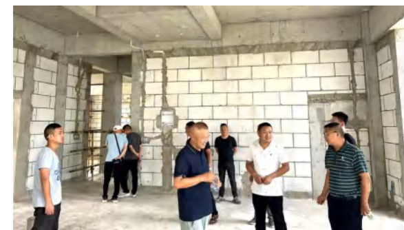
红安县公安局七里森林派出所主楼及接警大厅主体结构验收 (王若 摄)