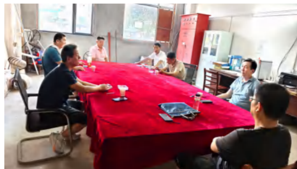
董事长研究指导黄冈建档案馆后续装修工程启动工作

9位专家教授分别以《拥抱AI、中药创新发展思考》、《道地药材品质提升的思考与探索》等为主题，就发展新质生产力，推动中医药高质量发展作大会报告。作为本次会议接待单位，英山华美达温泉度假国际酒店全力做好会务服务工作，酒店营销与前厅、客房、餐饮、会务各部门通力合作，全面保证了服务质量，并同步为参会者提供华美达康养药膳菜、花乐汤温泉中药浴养池、花海景区康养漫步道，以良好的接待形象为“毕昇故里·康养英山”增辉添彩。