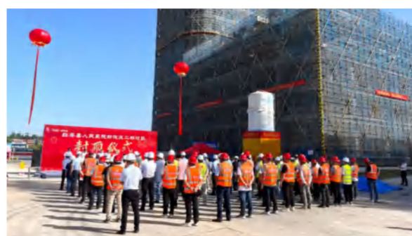
红安县人民医院新院区二期建设项目封顶仪式