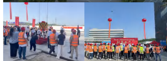
封顶现场照片和项目效果鸟瞰图