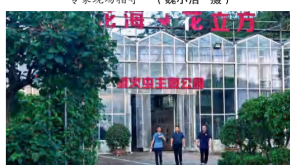
四季花海招商运营中心接待游乐项目合作考察的河南客户