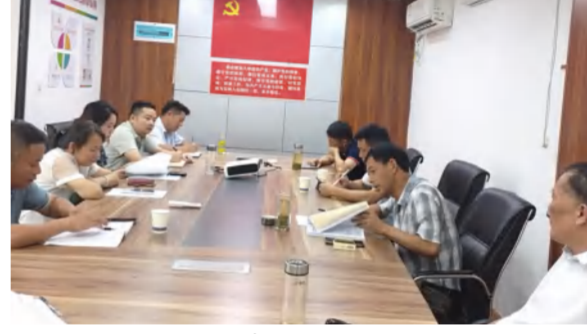
中泰地产公司与建筑事业部联席研究黄冈建档案馆建设项目工程分摊方案