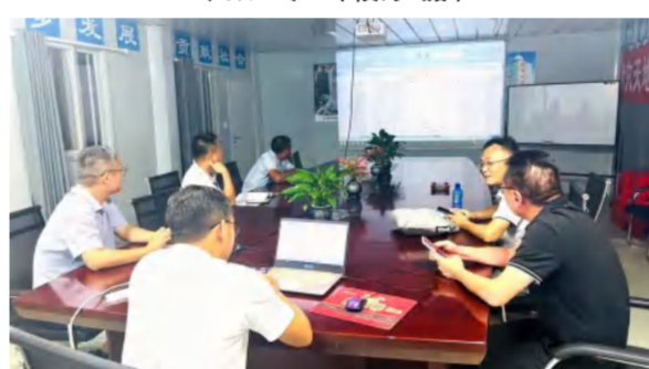
武穴天地项目样板间进度专题会

27、扶持绿色建筑相关单位和个人。对建设、购买、运行绿色建筑，或者对既有民用建筑进行绿色化改造的，予以扶持。督促、指导各部门落实税收、绿色金融、容积率奖励、公积金贷款、能源替代量抵扣以及评优、示范工程评选中优先扶持政策。(完成时间：持续实施；责任单位：省财政厅、省自然资源厅、省住建厅、省发改委、省水利厅、省地方金融管理局、省机关事务局、湖北金融监管局、人行湖北省分行、省税务局、各市、州、县人民政府)