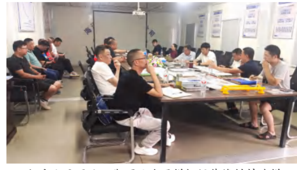
红安人民医院二期项目海通样板间装修材料选择碰头会