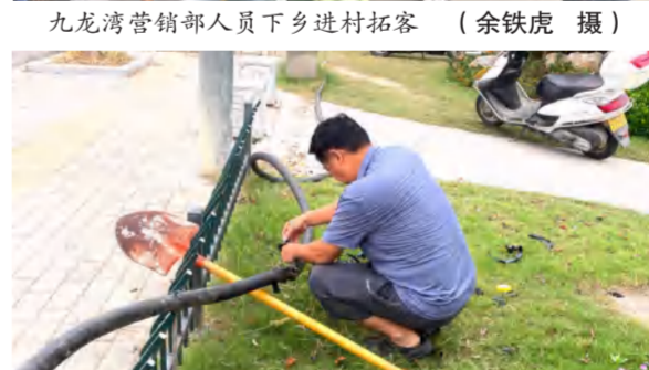
四季花海旅游工程部抢修两河口公园处泵房电缆