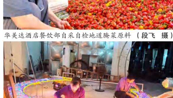
花乐汤温泉员工动手制作地区灯光布景