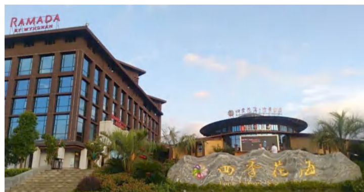
英山华美达温泉酒店全力做好会务服务工作

【英山融媒讯】8月31日，湖北省中医药学会中药分会2024年学术会议在英山县华美达酒店召开。湖北省中医药学会副会长、秘书长、湖北