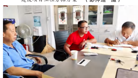
四季花海林地流转处置工作进村入户