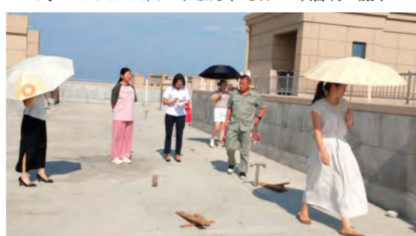
团风中泰大公馆16号楼甲方分户验收随机抽检