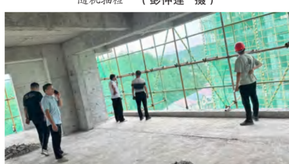
九龙湾A区工程质量检查