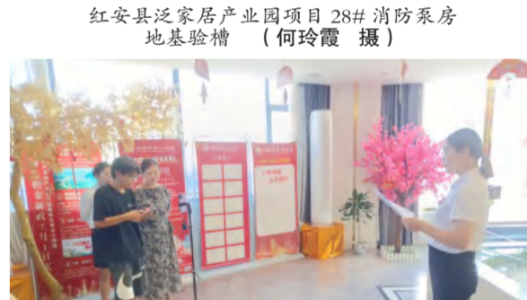
九龙湾营销中心销售直播演练