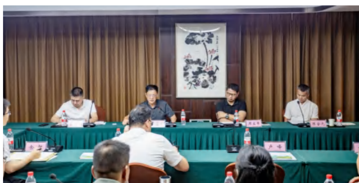
文旅康养产业发展座谈会进行中

才强县”战略，坚持把文旅康养产业作为县域发展的重要引擎，以文旅康养产业高质量发展助推英山实现绿色崛起。希望大家以此次会议为契机，与各位专家人才双向奔赴、携手同行，共享发展机遇，共创美好未来，为文旅康养产业振兴，加快推进绿色崛起，推动英山经济社会高质量发展贡献智慧和力量。