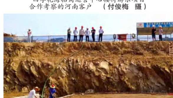
红安县泛家居产业园项目28#消防房地基验槽