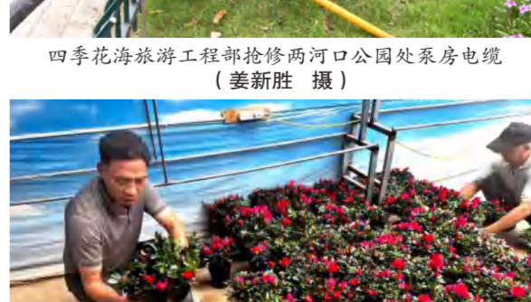
四季花海园林部到武汉花木市场开展询价调查