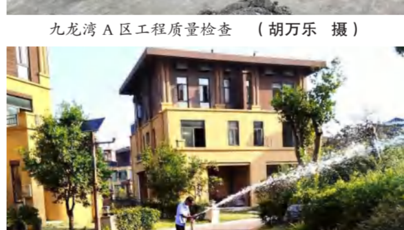
六合众物业加强九龙湾E区抗旱保苗