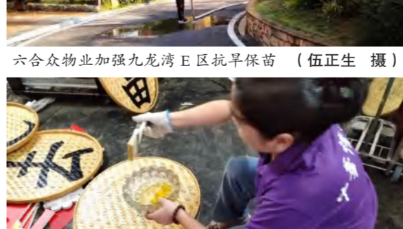
铭先文化公司员工自己动手为红线户外道具刷桐油