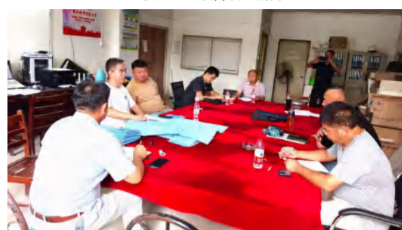
黄冈市城建档案馆项目消防验收前专家现场指导