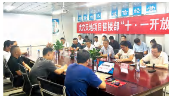
武穴天地项目售楼部“十一·开放”目标动员会