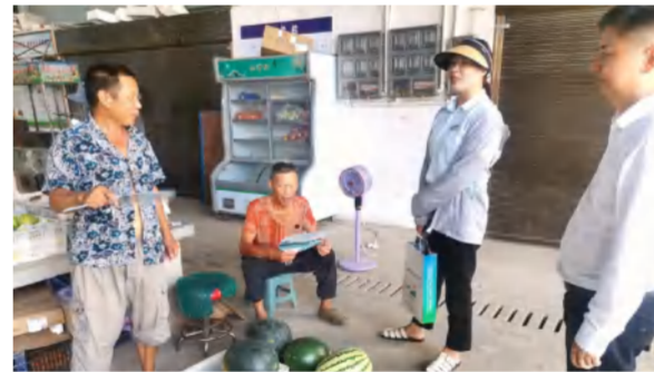
九龙湾营销部人员下乡进村拓客